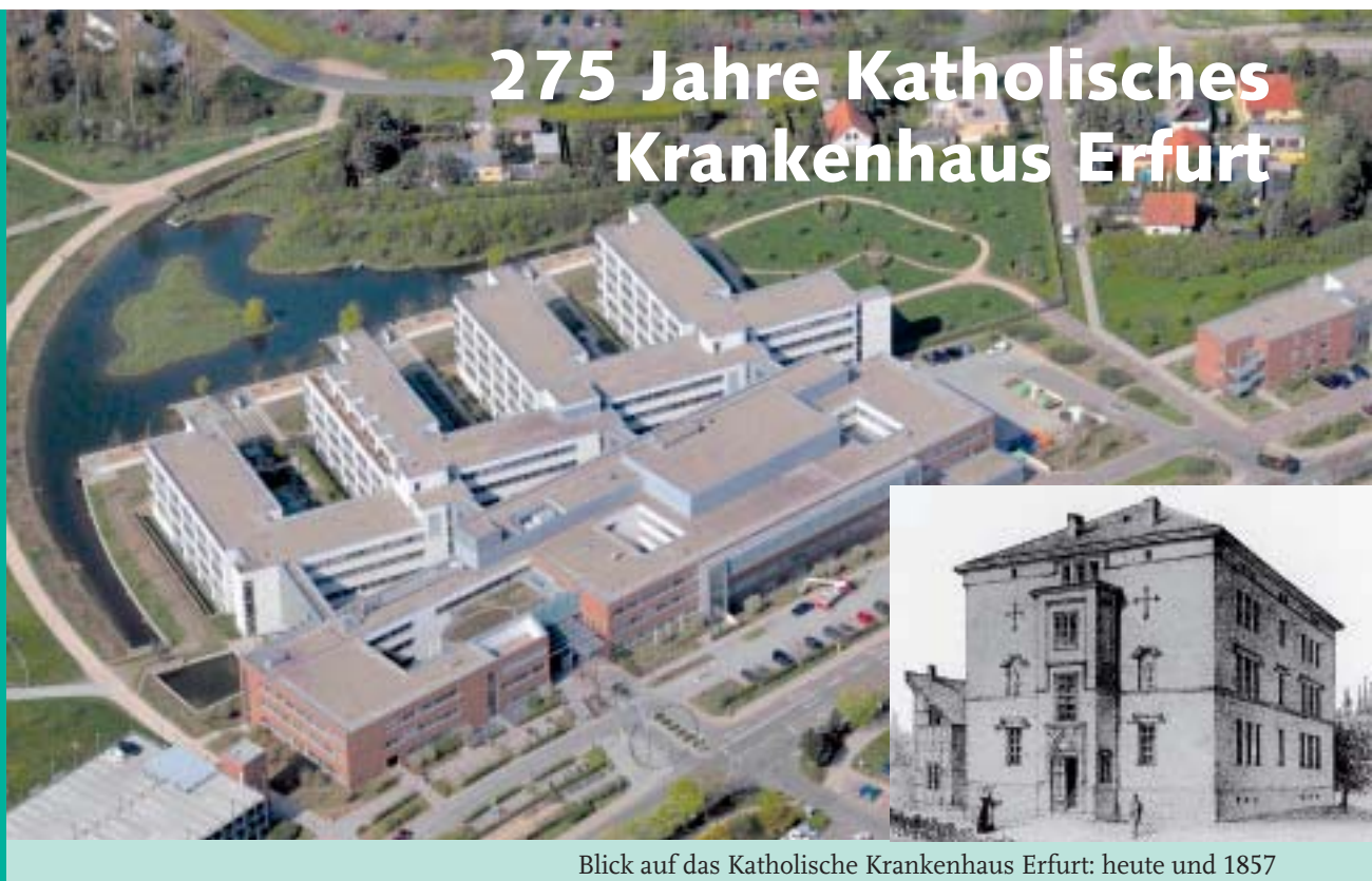
Blick auf das Katholische Krankenhaus Erfurt: heute und 1857