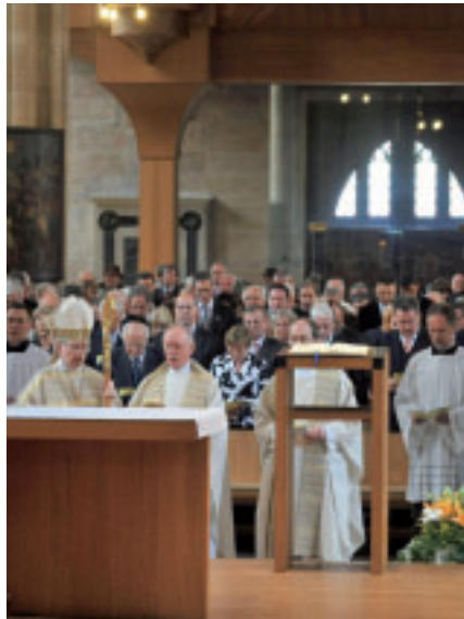
Festgottesdienst im Erfurter Dom aus Anlass des Krankenhausjubiläums am 16. Juni 2010

Die Fallzahlen des neuen Katholischen Krankenhauses sprechen eine deutliche Sprache: Immer mehr Patienten entscheiden sich für eine Behandlung im Nepomuk-Krankenhaus. Am alten Standort lagen die vollstationären Fallzahlen jährlich zwischen 12 000 und 13 000 Patienten, damit waren die örtlichen Kapazitätsgrenzen erreicht. Im neuen Kran-