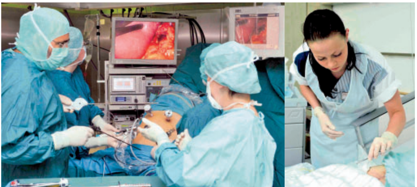
Krankenhausalltag zwischen der Anwendung hochtechnisierter und spezialisierter Medizin und Pflege und menschlicher Zuwendung.

Abgesehen vom oft desolaten Zustand der Häuser, der nur mühsam durch den besonderen Einsatz des gesamten Personals wettgemacht werden konnte, kamen die wachsenden verkehrstechnischen Anforderungen einer