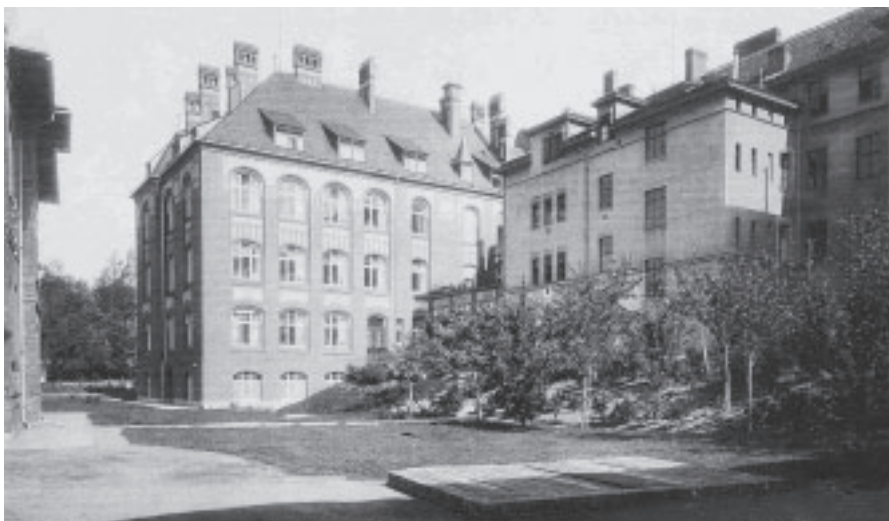
Das „Rote Haus“ war Anfang des 20. Jahrhunderts der modernste Teil des Katholischen Krankenhauses Erfurt.