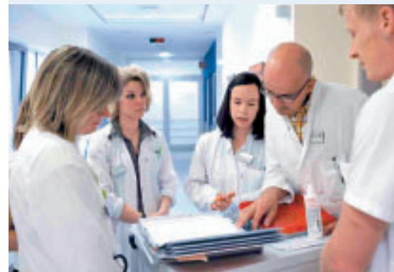
Die Patienten schätzen die kooperativ orientierte, qualifizierte und zuwendungsorientierte Medizin und Pflege im „KKH“.