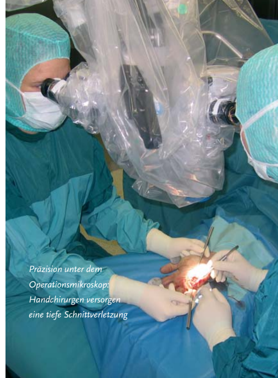
Präzision unter dem Operationsmikroskop: Handchirurgen versorgen eine tiefe Schnittverletzung

Ein weiteres Spezialgebiet unserer Klinik umfasst die Hand- und Fußchirurgie. In der Handchirurgie werden sowohl Patienten mit Handverletzungen als auch Patienten mit einem Morbus Dupuytren oder einer vorliegenden Arthrose gezielt versorgt. Zusätzliche Schwerpunkte sind die Behandlung von Engpassyndromen sowie die Durchführung von Sehnenplastiken. Im Bereich des Fußes werden unter anderem die Krankheitsbilder Frostballen ( Hallux valgus ), Krallen- und Hammerzehe behandelt.