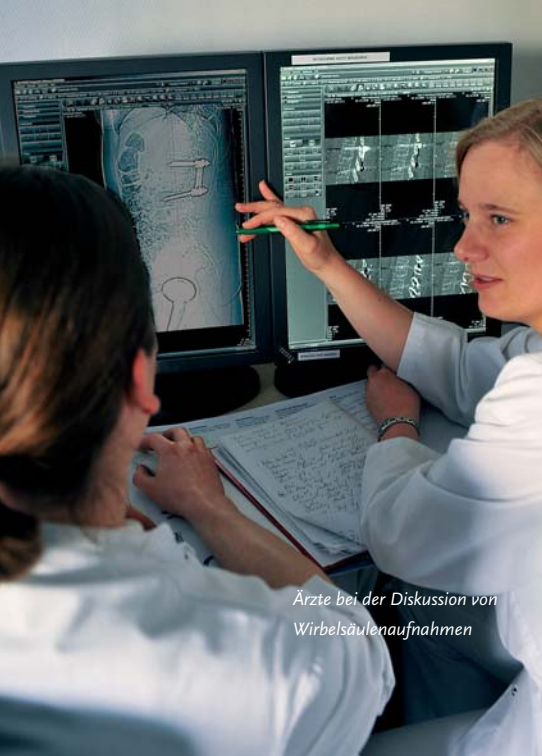
Ärzte bei der Diskussion von Wirbelsäulenaufnahmen